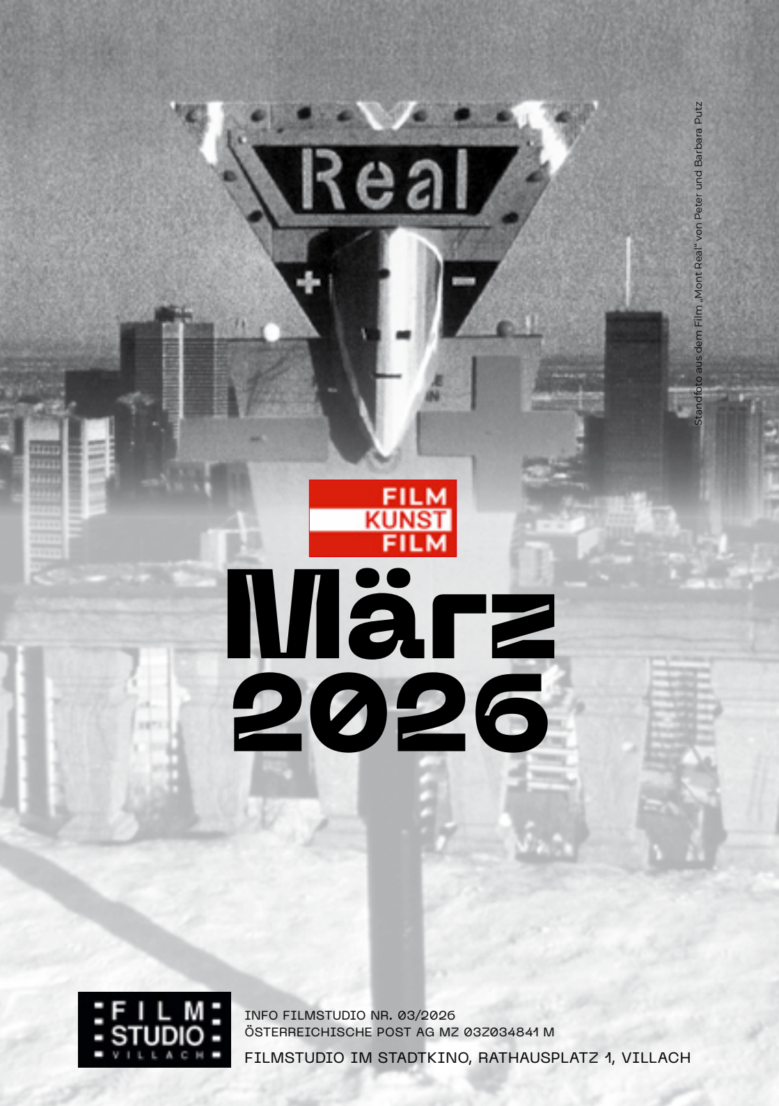
Standfoto aus dem Film „Mont Real“ von Peter und Barbara Putz